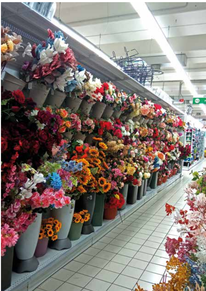
Ci sentiamo liberi, ma non lo siamo