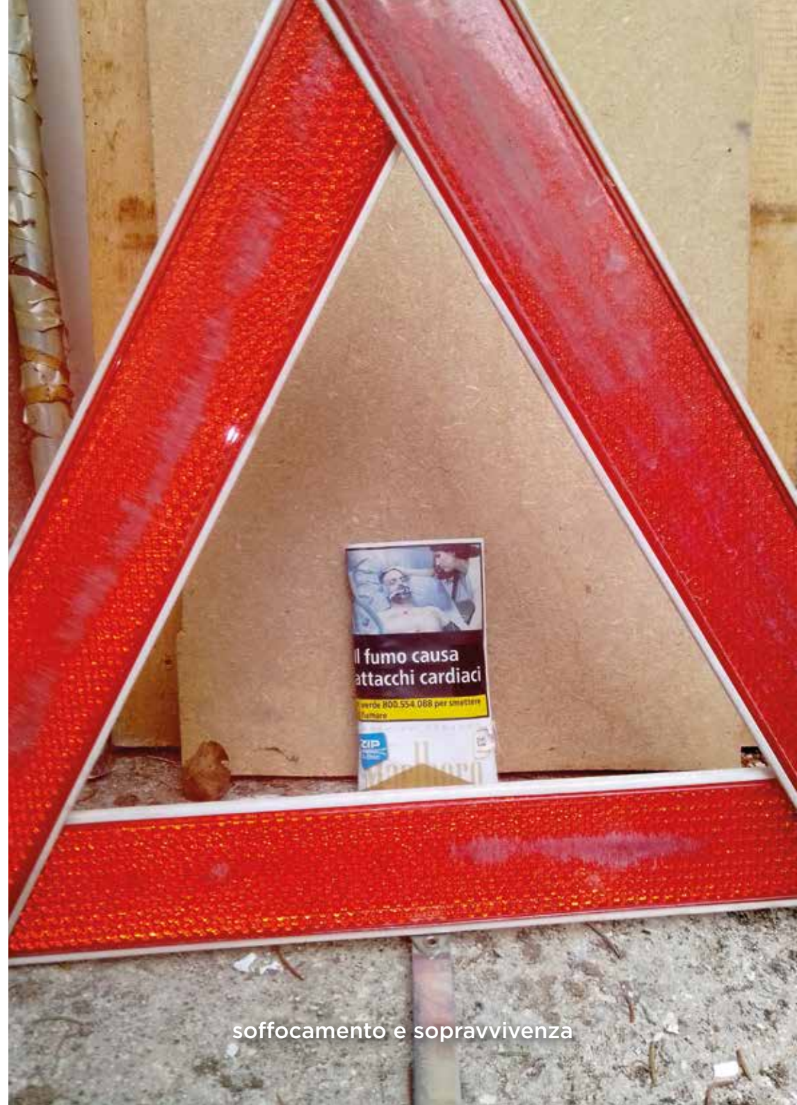
soffocamento e sopravvivenza