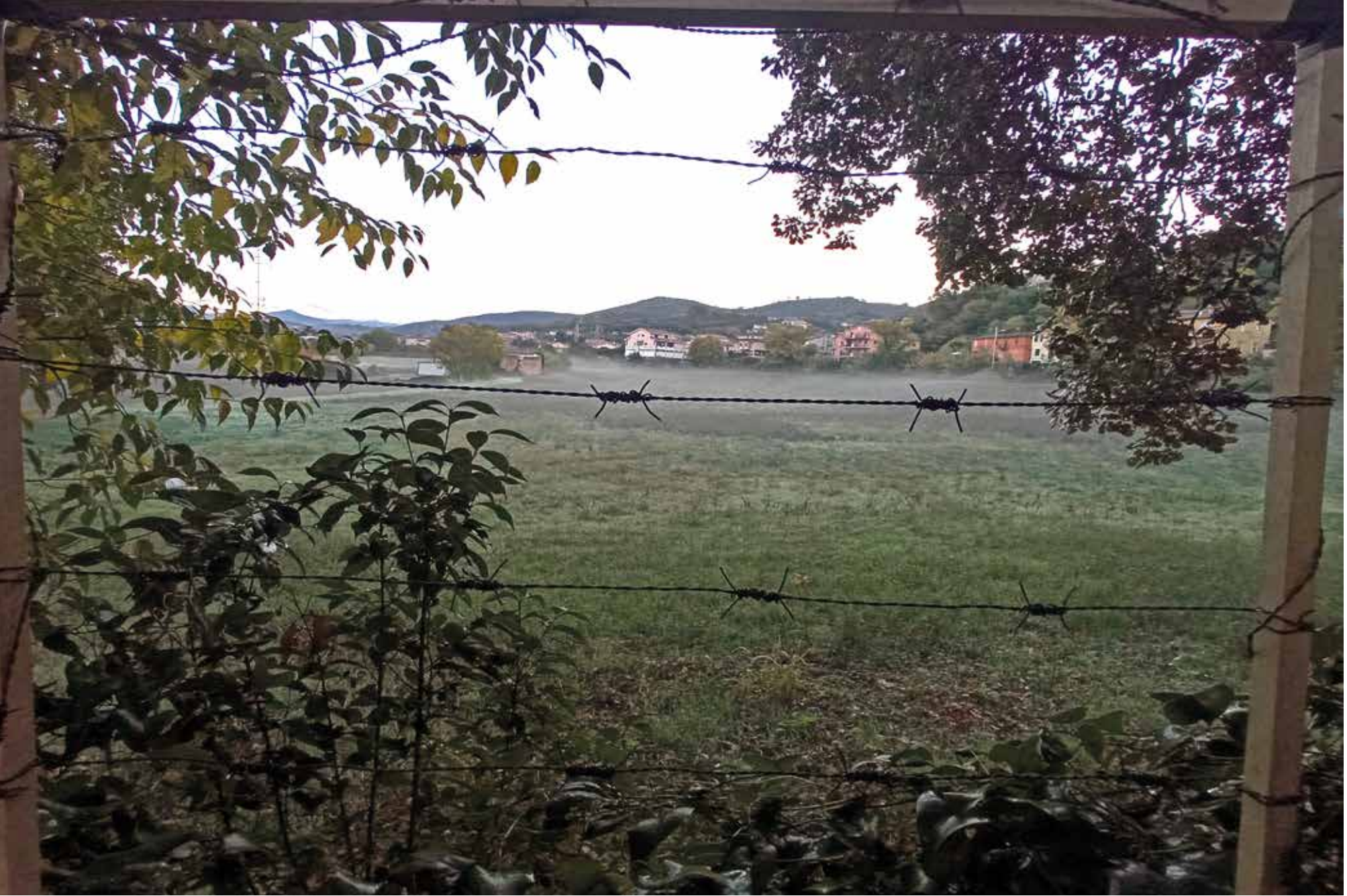
Natura che controlla